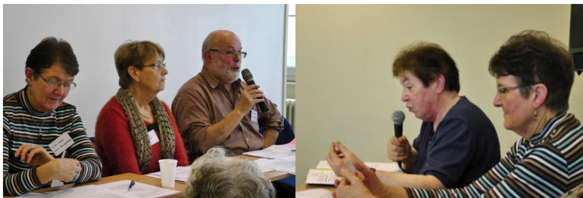
Présentation des rapports