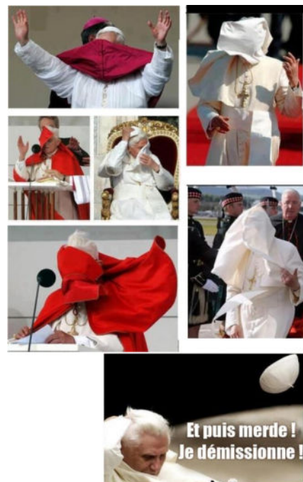
Le vent souffle où il veut...

Danièle Hervieu-Léger, sociologue Publié sur Le Monde.fr | 28.02.2013